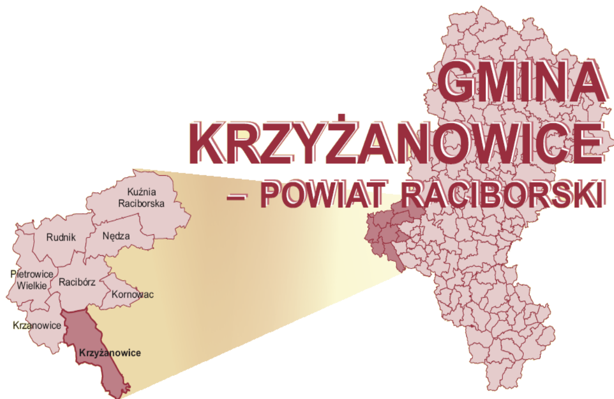
Rysunek 1 Mapa Powiatu Raciborskiego z Gminą Krzyżanowice

Gmina Krzyżanowice położona jest na południowym zachodzie województwa śląskiego i w południowej części Powiatu Raciborskiego. Graniczy od południa z Republiką Czeską, od północy z miastem Racibórz, od wschodu z Gminami Gorzyce i Lubomia, natomiast od północnego zachodu z Gminą Krzanowice. Większość obszaru Gminy leży w dolinie Odry.